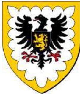
de Dion (Brabant)