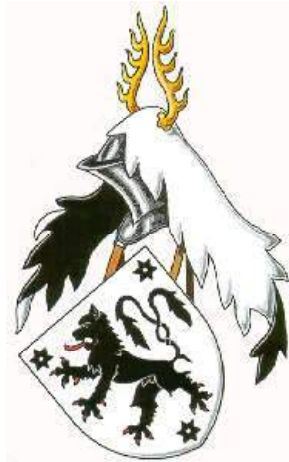
Louis de Coustes cimier