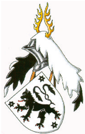
Louis de Coustes cimier