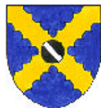
Armes des Le Mercier