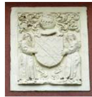
armes des Gentien (par leurs descendants Hennequin alliés aux de Mesmes) (Ecuries du château, Parc de la Mairie de Roissy)