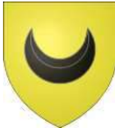
de Mesmes armes originelles