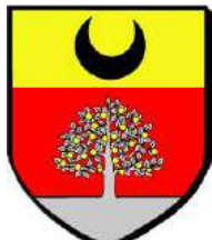
Les communes de Moissy-Cramayel (77) et de Bougival (78) ont conservé le croissant de sable des de Mesmes (Joseph, seigneur de Bougival 1774)