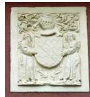
armes des Gentien (par leurs descendants Hennequin alliés aux de Mesmes) (Ecuries du château, Parc de la Mairie de Roissy)