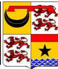
Antoine de Mesmes (brisure de cadet : 1 lambel de gueules à 3 pendants)