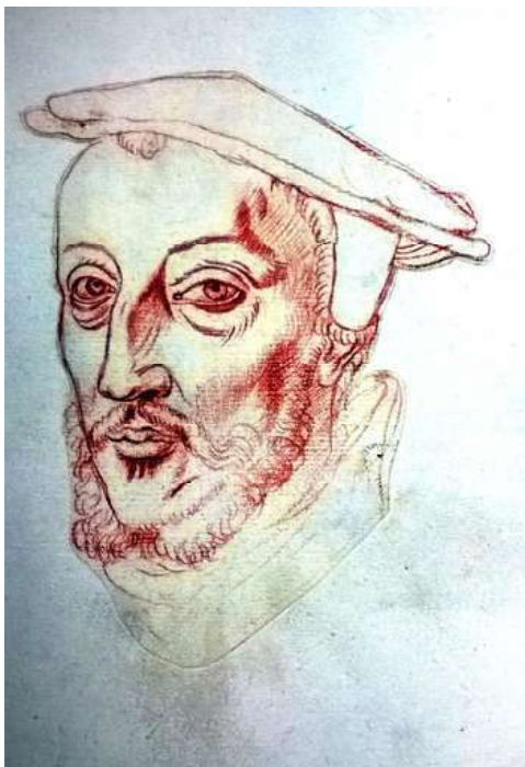
Pierre de Werchin ° ~1500 + 1556/57 seigneur de Cysoing et de Roubaix, comte de Werchin, Grand-Sénéchal de Hainaut, Chambellan de Charles Quint, Gouverneur de Tournai & de Luxembourg (Recueil d'Arras)

(Contribution de Jean-Luc Delefosse, 01-04/2017)