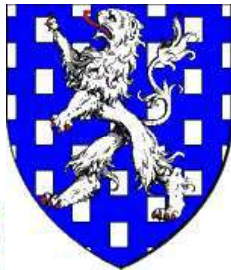
Jean de Werchin Sénéchal de Hainaut