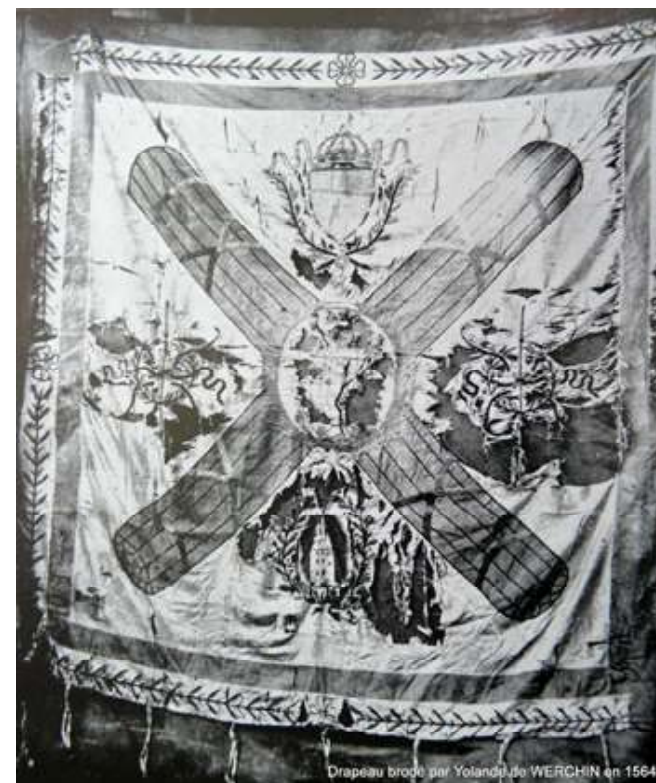
Drapeau brodé en 1564 par Yolande de Werchin-Barbençon

drapeau brodée en 1564 par Yolande de Werchin-Barbençon + 16/05/1593 marquise de Roubaix, dame de Werchin, Walincourt, Biez, La Longueville, Cysoing, Herzelles, Risbourg, etc., Sénéchale de Hainaut ( Histoire de la Ville d'Antoing )