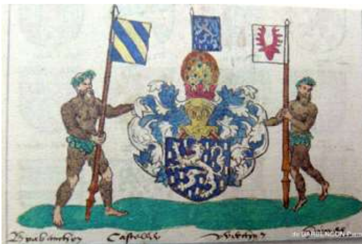
Grandes armes de Pierre de Werchin