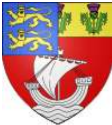
Le armes des Voyer, conservées dans celles d'Asnières- sur-Seine (92)