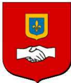
Vic, seigneurs de Morand en Touraine