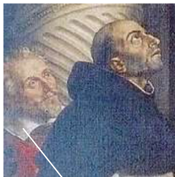
Dominique de Vic

alors qu'il avait été conçu pour la paroi de gauche (voir les parties éclairées par le peintre) puisque c'était l'orientation de l'autel (d'ailleurs, l'oeil pouvait monter de la Vierge du tableau vers la Vierge de l'Assomption peinte sur la voûte).»