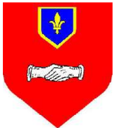
Dominique de Vic