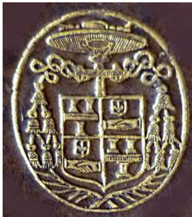
Ex-libris de Dominique II de Vic (~ 1611) ° 1588 + 1661 prélat, Prieur de Longpont, Archevêque d'Auch

15 mai 1629. Acte de procuration du dit Dominique de Vic à Jacques Prunier, clerc du diocèse de Cahors, pour prêter serment entre les mains de l'Archevêque de Rouen, comme Abbé commendataire de l'Abbaye du Bec-Hellouin.