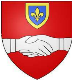
les armes de Dominique & Méry de Vic intégralement conservées dans celles de la commune d'Ermenonville (60)