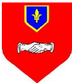
Dominique de Vic