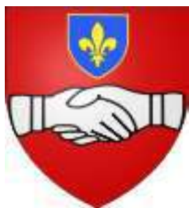
Vic, seigneurs d'Ermenonville