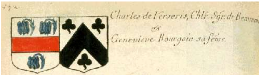
Charles de Versoris, seigneur de Beauvoir