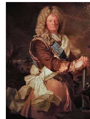
Le Maréchal de Vauban portraiture en pied