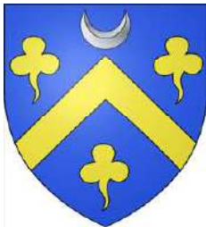
Le Prestre de Vauban