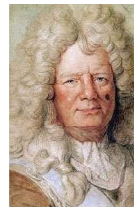
Portrait du Maréchal de Vauban par Lebrun

La fin de la vie du Maréchal de Vauban est marquée par l'affaire de la Dîme Royale : dans cet essai, distribué sous le manteau malgré l'interdiction de diffuser, Vauban propose un audacieux programme de réforme fiscale pour tenter de résoudre les injustices sociales et les difficultés économiques des «années de misère» (1692-93-94 sont des années de disette alimentaire épouvantables) de la fin du règne du Roi Soleil .