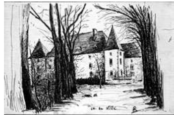
château des Thibault de Ménonville à Villé (Nossoncourt, 88)