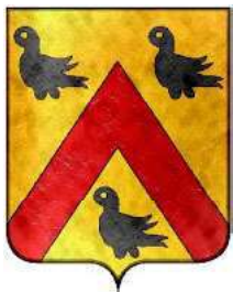
Thibault de Ménonville