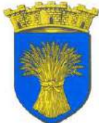
Campdavène La Houssoye