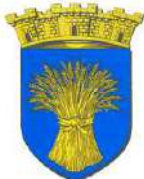
Campdavène La Houssoye