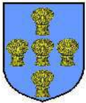
Hugues de Saint-Pol «Campdavène»