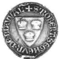
Campdavène-Beauval sceau de Robert (1262)