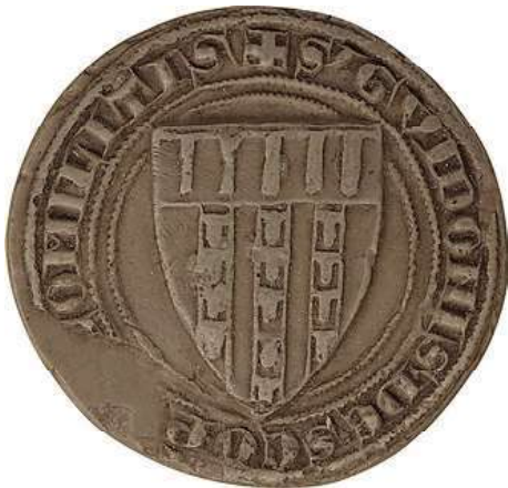
Gui III de Châtillon, comte de St-Pol : sceau