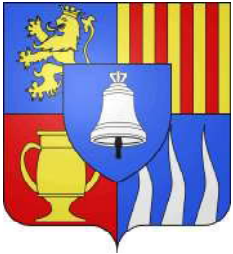
Roger II de Saint-Lary