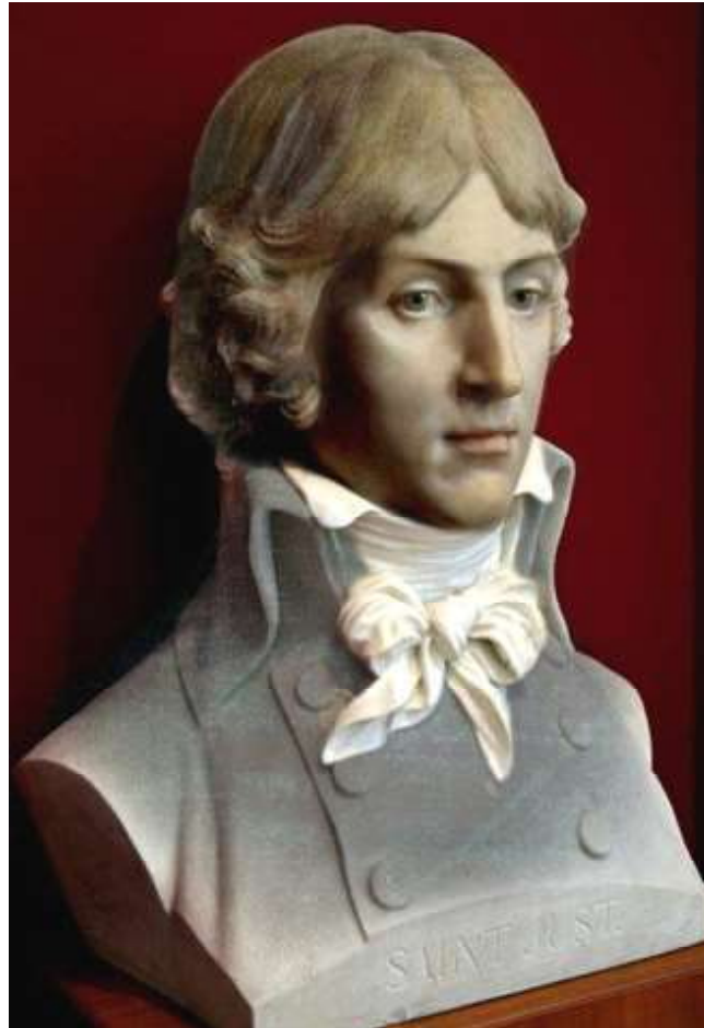
Louis-Antoine Leon (de) Saint-Just interpretation du meme buste de David d'Angers