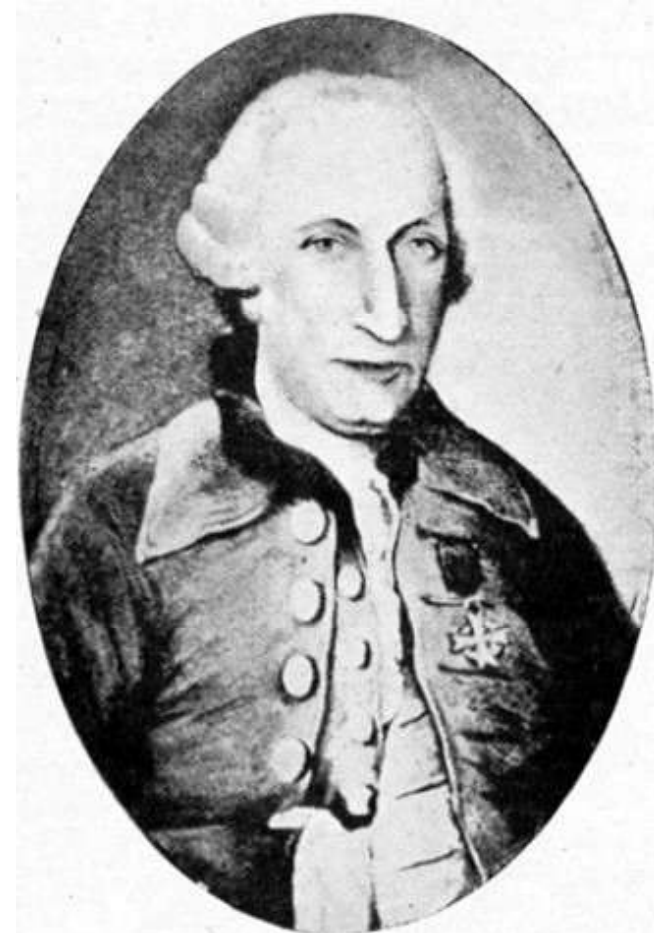
Louis-Jean de Saint-Just en chevalier de Saint-Louis (médaillon)