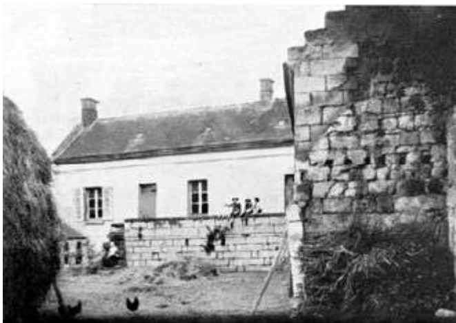
La maison des Saint-Just à Nampcel (60)