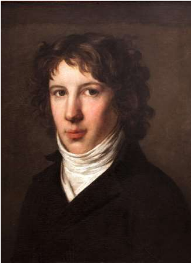
Louis-Antoine Léon (de) Saint-Just, par Pierre-Paul Prudhon 1793 (Lyon) Probablement un des portraits les plus fiables - par un artiste qui fréquentait le cercle Robespierrieste et a bien connu son modèle.