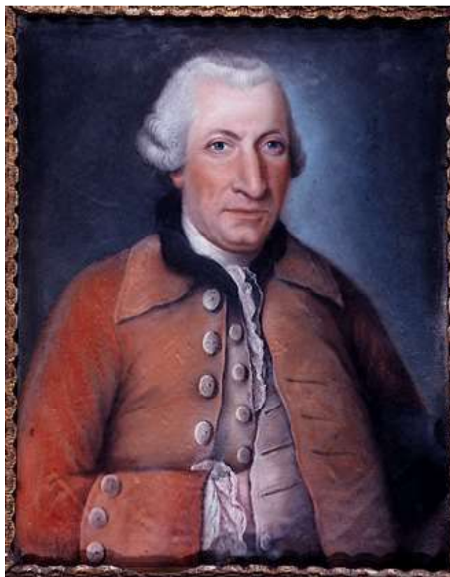
Louis-Jean de Saint-Just de Richebourg (portrait anonyme)