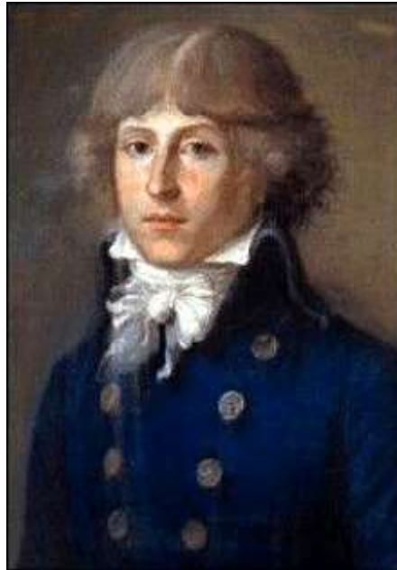
Louis-Antoine Léon (de) Saint-Just Ce portrait semble assez fidèle (Musée Carnavalet)