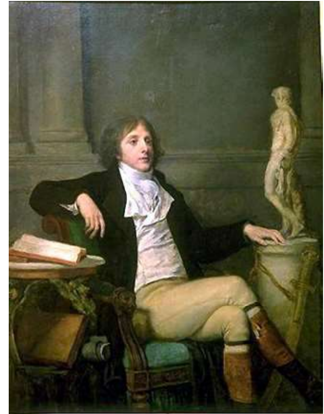
Louis-Antoine Léon (de) Saint-Just Ce portrait semble également plausible