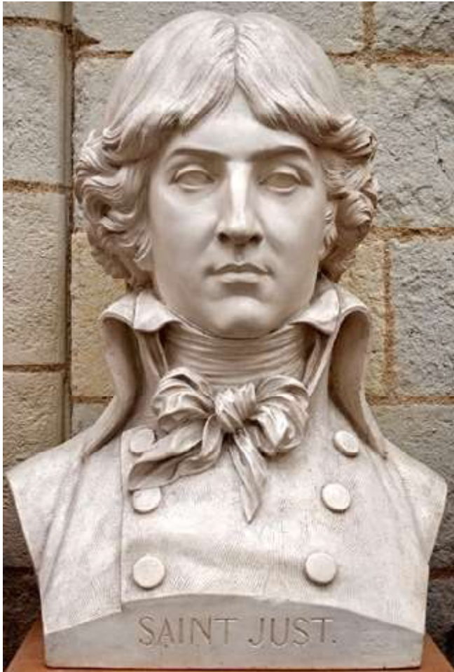
Louis-Antoine Leon (de) Saint-Just buste par David d'Angers 1848 (Angers)