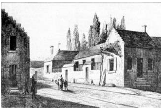
La maison des Saint-Just à Blérancourt (02)