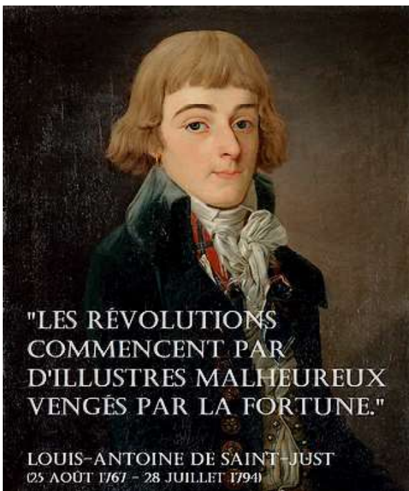
Louis-Antoine Léon (de) Saint-Just