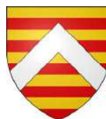
Aldonce de Braquemont

1) Mahaut de Rouville + ~1424 Abbesse de Saint-Amand de Rouen