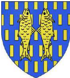
Gougeul de Rouville