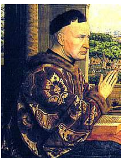
Le Chancelier Rollin peint par Jan van Eyck

Origines : Bourgeoisie Autunoise (anoblissement début XV e )