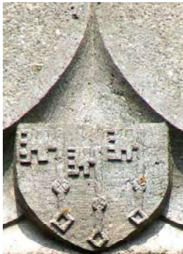
Rollin : blason sculpté au château d'Oricourt