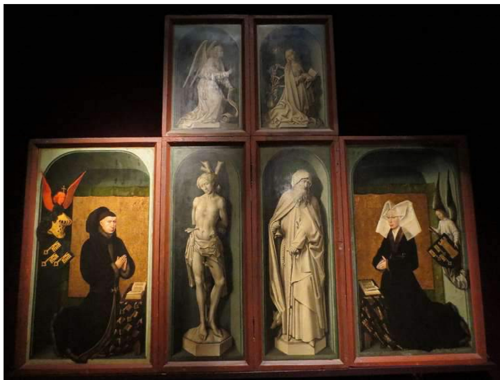
Nicolas Rollin & sa femme Guigone de Salins portraits des donateurs, polyptyque du Jugement dernier de Rogier van der Weyden, musée de l'Hôtel-Dieu, Beaune

Nicolas Rollin ° ~1376 + 18/01/1462 Avocat du duc de Bourgogne au parlement de Paris puis de la Cité de Saint-Omer, Chancelier de Bourgogne, seigneur de Rupelin, Anthumes, Chasseu, Monetoy, Aymeries, Raismes, Savoisy et Rugny, Vidame de Châlons, Grand-Veneur héréditaire du Hainaut