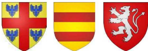
Monthéry, Garlande & Montfort