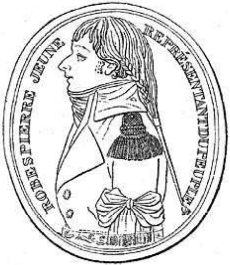
Augustin-Bon Robespierre en 1793 Augustin-Bon de Robespierre, d'après une médaille frappée à l'occasion de la reprise de Toulon sur les Anglais.

COMMUNE DE PARIS. Comité d'Instruction Le 9 Thermidor Courage Patriotes de la Section du Lion, Sabbotel Triomphe déjà connu que l'on fera tout attendre pour l'été aux Parisiens et tout en Liberté, partons de la capitale pour aller à la guerre Le Comité de Révision est ada (uniquement) et tout ce qu'il y a de bon et de vertueux dans la capitale d'Instruction qui est une pour sauver la patrie. Augustin-Bon Robespierre Le 9 Thermidor