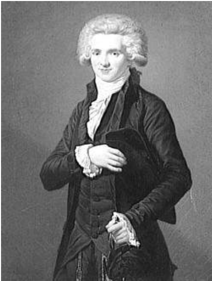
Maximilien Robespierre jeune Avocat à Arras