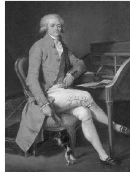
Maximilien Robespierre Député aux Etats-Généraux, à la Constituante puis à la Convention Nationale entre 1790 et 1794