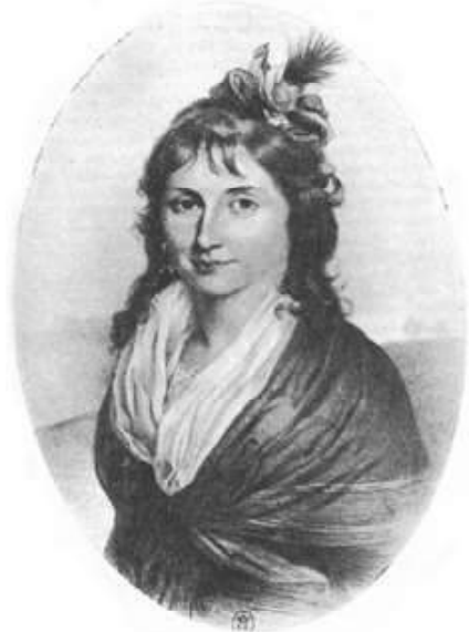
Charlotte Robespierre lithographie parue à sa mort en 1834 10