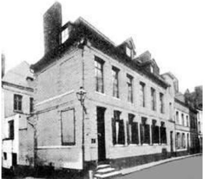
La dernière maison où logea Maximilien Robespierre à Arras, rue des Rapporteurs.