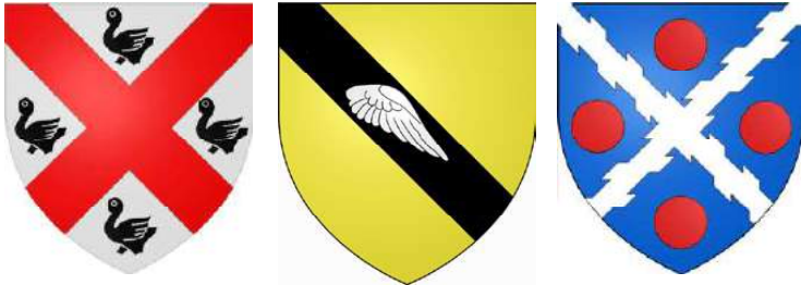
3 blasons attribués à la famille (de) Robespierre : 1) Willaume au XV° 2) Yves au XVIII° 3) selon glossaire canadien