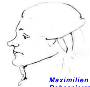
Maximilien Robespierre croqué par Gros en 1794