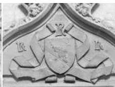
Robertet : blasons sculptés (Montbrison)