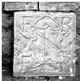
Robertet : blasons sculptés (Hôtel d'Alluyes)