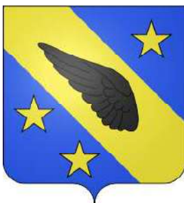
Robertet (également armes de la commune de Brou)