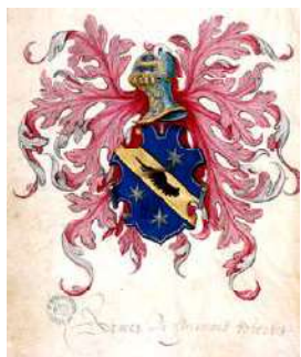
Robertet : grandes armes de Florimond