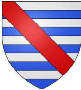
L'Archevêque de Parthenay