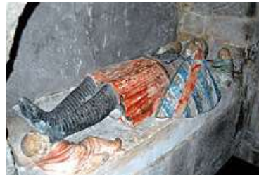
Gisant de Guillaume VII L'Archevêque de Parthenay + 1401 (église Sainte-Croix à Parthenay)