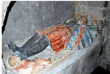
Gisant de Guillaume VII L'Archevêque de Parthenay + 1401 (église Sainte-Croix à Parthenay)