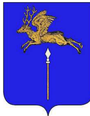
Choppin "D'azur, au cerf ailé soutenu d'une pique en pal, le tout d'or." alias "D'azur, à une pique d'argent, fûtée d'or, surmontée en chef d'un cerf ailé d'or."