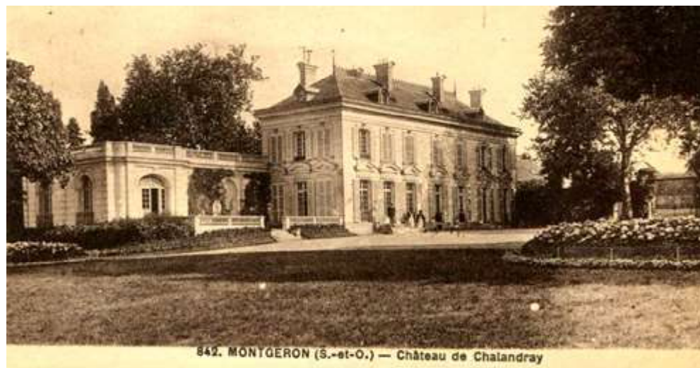
Château de Chalendray à Montgeron

De 1776 à 1804, il est la propriété de Louis-Pierre Parat de Chalendray qui transforme les parterres à la française, en jardin à la française, avec l'aide du paysagiste Morel de Lyon .