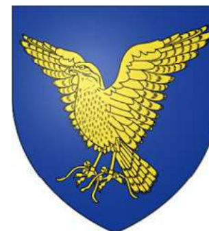
Le Tonnelier de Breteuil