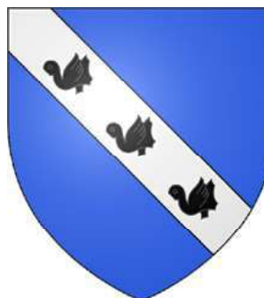
Bourgeois de Boynes "D'azur, à la bande d'argent chargée de trois merlettes de sable."