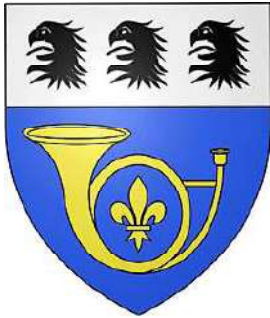
La Commune de La Celle-Saint-Cloud (78) a conservé les têtes d'aigles arrachées de sable des Parat de Chalandray