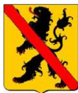
Namur (ancien) variante