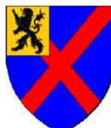
Namur (bâtard de Seraing)