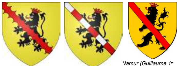
Namur cadets (Beaumont)