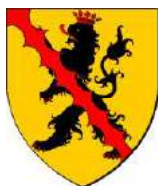
Namur (Robert de Beaumont)