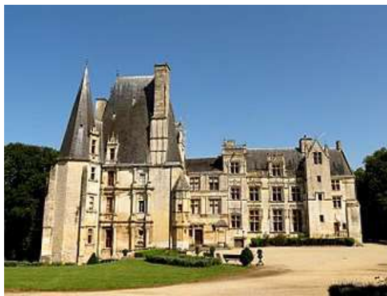
Fontaine-Henry (Calvados) passe des Harcourt aux Morais