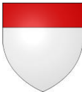
Marquis de Montferrat