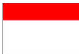
bannière de Montferrat