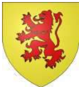
Ranulf de Meschin