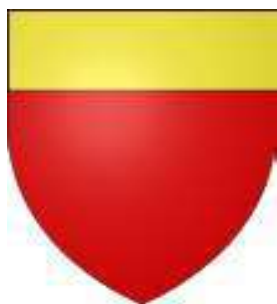
Châtellains de Lille