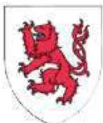
Le Puiset (Pierre de Mésalant/Mézelan)