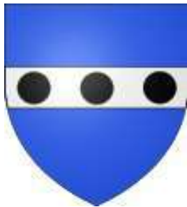
Landouillette de Logivière