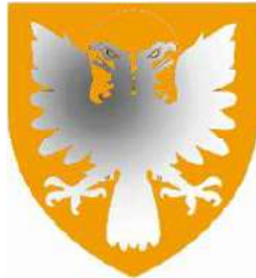
Laigle ancien (présumé)