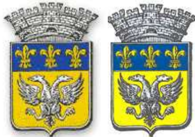
Laigle (armes modernes de la cité)