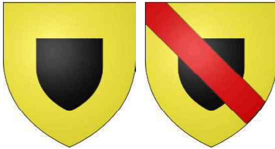
L'Orfèvre d'Orfeuil (Pierre)