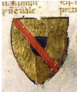
Pierre L'Orfèvre, Avocat au parlement de Paris + 1416