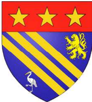
du Barry (ancien)

- ultérieurement remplacées par des armes de prétention calquées sur une famille homonyme de Barry en Irlande