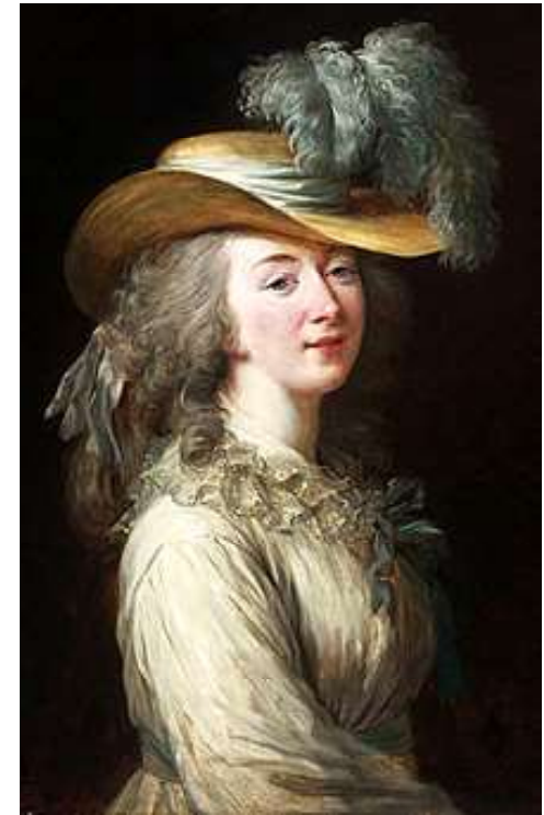
Mme du Barry par Mme Elisabeth Vigée-Lebrun (1782) Corcoran Gallery of Art (Washington).