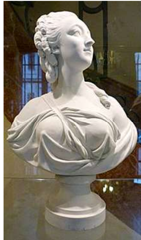
Comtesse du Barry, biscuit de Sèvres Loché d'après Pajou (Versailles, musée Lambinet)