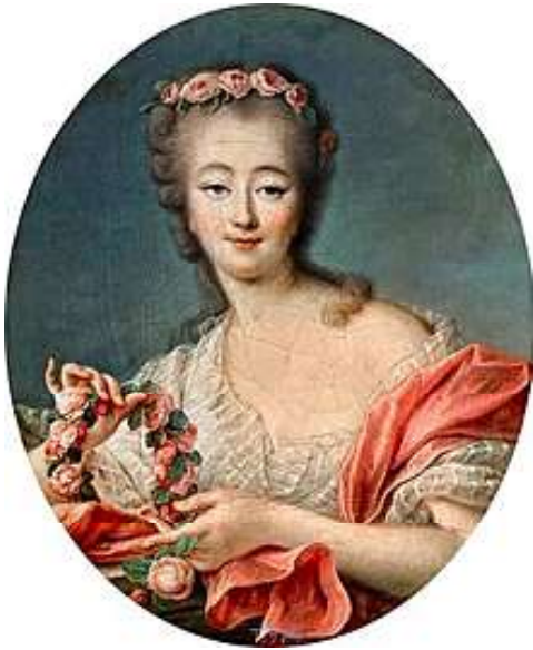
Jeanne Bécu dite Comtesse du Barry par Drouais.