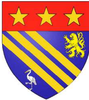
du Barry (ancien) selon le Grand Armorial de France