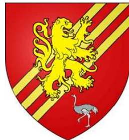
Armes attribuées (à tort semble-t-il) aux du Barry (ancien)

Jeanne Bécu, Madame Dubarry, comtesse du Barry