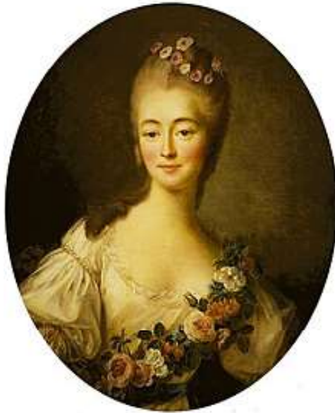
Comtesse du Barry en Flore (1769)