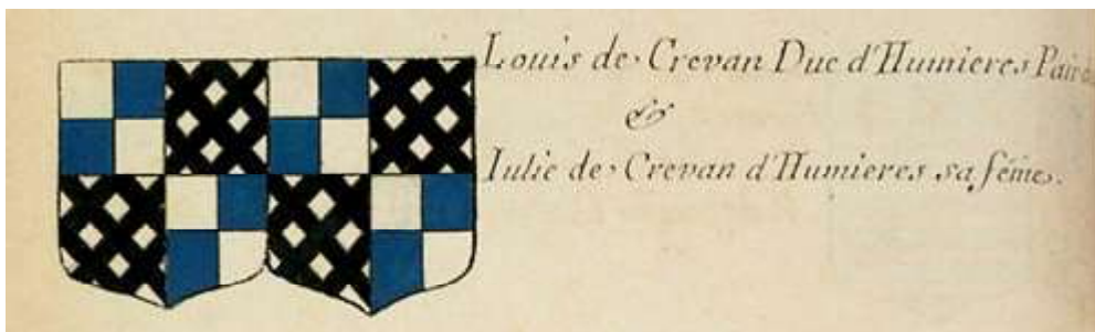
Louis & Julie de Crevant d'Humières, duc & duchesse d'Humières (Armorial de Paris)