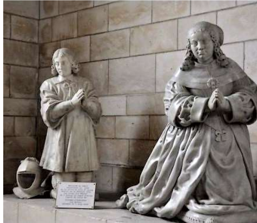
Philippe de Torcy + 1652 & Suzanne d'Humières ° ~1584 + 1644 (> cf. p.10) vestiges de leur tombe rescapés de la cathédrale), sauvagardés à Saint-Vaast d'Arras