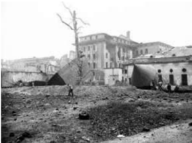
La Chancellerie du Reich en 04/1945