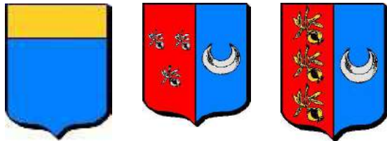
Grenier, Garnier, d'Agrain ?

Famille Grenier alias Garnier, Granier, d'Agrain