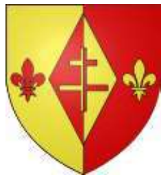
Gometz-La-Ville & Gometz-Le-Châtel (91) blasons des communes actuelles