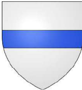
Giroie, seigneurs de Saint-Céneri