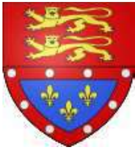
Echauffour (commune, 61)