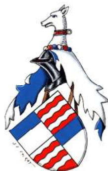
Grandes armes de Jean de Gamaches , compagnon de Jeanne d'Arc à Orléans (1429) : écartelé Gamaches/Fécamp (par Jean-Claude Colrat)