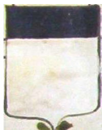
Gilles de Gamaches (représentation ancienne)