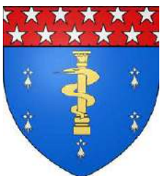
Fouché, duc d'Empire, duc d'Otrante, GCLH