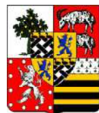
Estrées -Lauzières -Thémines