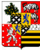
Estrées -Lauzières -Thémines