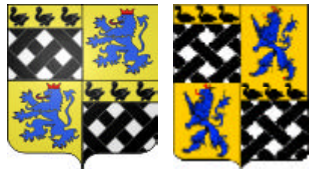
Jean, François-Annibal et Gabrielle d'Estrées