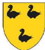
Raoul, seigneur de Vez- en-Valois en 1214