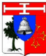
Nogaret de La Valette, ducs d'Epernon (Jean Louis, Bernard)