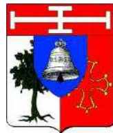
Nogaret de La Valette, ducs d'Epernon (Jean Louis, Bernard)