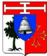
Nogaret de La Valette, ducs d'Epernon (Jean Louis, Bernard)