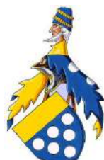
Poitiers-Saint-Vallier (cimier de Charles II)