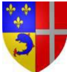
duché de Valentinois

Diane de Poitiers Poitiers-Valentinois Poitiers-Saint-Vallier