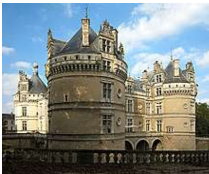
Château du Lude