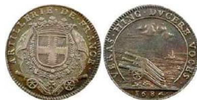
Henri de Daillon : jeton 1684