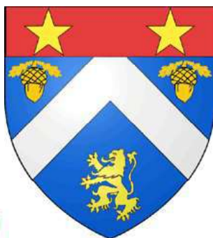
Cyrano de Bergerac