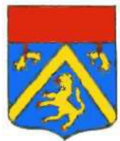
Cyrano de Bergerac selon Palliot, 1660