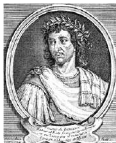
Savinien Cyrano de Bergerac se prénommant parfois lui-même : Alexandre...