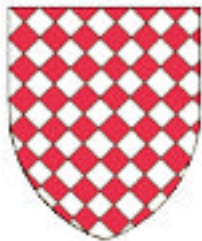
Etienne de Crespin