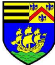
les armes des Coëtivy écartelées avec celles des La Trémoille dans le blason de la Ville de Royan