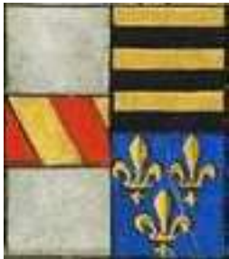
armes de Marguerite de Coëtivy + 1512 combinées avec celles : de son époux (Pons) et rappel de celles de sa mère Marie de Valois, bâtarde de France (extrait d'un ex-libris)