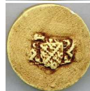
[ sceaux ? Geoffroi, Rénier, Bernard & Jean de Bonnes ? "Familles parisiennes notables aux XIV e & XV e siècles", O. & Ph. de Mauregard ]