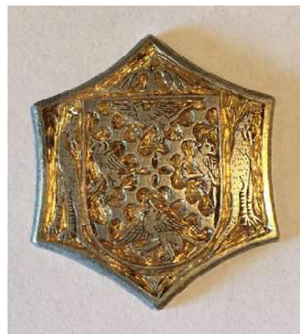
[ élément de médaille, de fermoir, de broche ou d'insigne de pèlerinage ? trouvée dans le Nord-Est par «Ticou», http://www.detecteur.net/forum/viewtopic.php?t=86391 ]

Variantes : Cocatrix (76, 62) et sans doute Cocatre (51). Il a servi à désigner le crocodile, mais surtout toutes les bêtes fantastiques, en particulier le dragon. Godefroy signale dans son Lexique de l'ancien français que le terme a été utilisé comme surnom pour désigner celui qui portait le dragon dans les processions (mentions à Troyes, Sens et Auxerre).