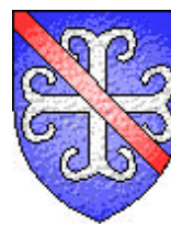
Guillaume du Tournel 1221