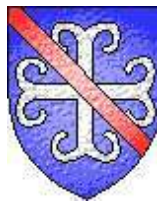
Guillaume du Tournel 1221