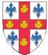
Simon de Chevreuse, seigneur de Dampierre