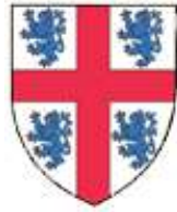
Anseau de Chevreuse, seigneur de Maincourt