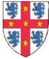
Simon de Chevreuse