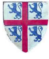
? Anseau II de Chevreuse (blason devenu (à droite, avec quelques variantes) celui de la commune actuelle de Chevreuse, 78)