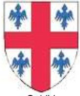
Gui IV de Chevreuse, seigneur de Neauphle