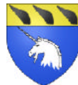
Chevalier (Flandres 2)