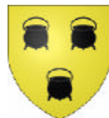
Chevalier (Flandres 1)