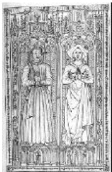
Pierre tombale d'Etienne Chevalier et de Catherine Budé à Melun