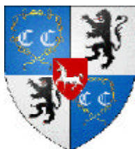
Chevalier seigneur de Wideville