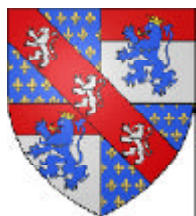
Louis II de Vendôme