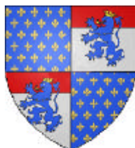
probable Vendôme- Chabanais

François de Vendôme ° 1523 + 22/12/1560 (Paris) Vidame de Chartres, Prince de Chabanais, seigneur de La Ferté-Arnaud, seigneur de Lassay, La Chartre, Milly, Pouzauges, Thissanges, Confolens, chevalier de l'Ordre du Roi (Saint-Michel), guidon de 50 lances sous le seigneur de Boisy (1543) puis capitaine de 40 lances des ordonnances (22/12/1547) puis de 50 lances (20/01/1558), otage en Angleterre en garantie du Traité de Boulogne (24/03/1549, avec Aumale et Annebaut), X à Cérises (1544), au siège de Metz (1552), Colonel-Général de l'Infanterie- Française (Bandes-Françaises) en Piémont (1557, remplace son parent Bonnavet, oncle de sa mère Hélène Gouffier), partisan des Guise puis des Bourbons-Condé et des Montmorency, Gouverneur de Calais (1558), refuse la main de Louise de Brézé, fille de Diane de Poitiers, en disgrâce et emprisonné à la Bastille (27 ou 29/08/1560)