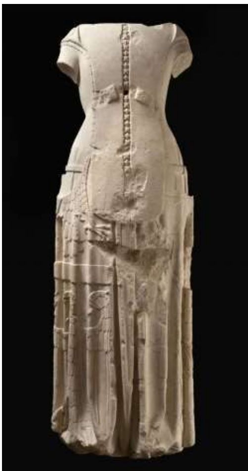
Biette Cassinel, gisant (1394), Musée Carnavalet, Paris