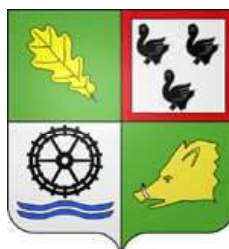
Le blason de Méré (28) conserve une trace de la famille Caruel

Normandie (diocèse d'Evreux), Picardie (Laonnois, Beauvaisis), Ile-de-France, Drouais