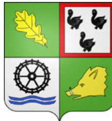
Le blason de Méré (28) conserve une trace de la famille Caruel

Normandie (diocèse d'Evreux), Picardie (Laonnois, Beauvaisis), Ile-de-France, Drouais