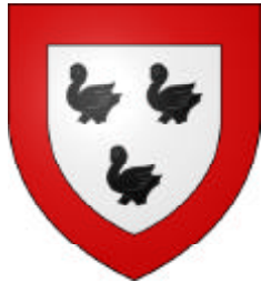
Caruel de Méré