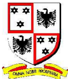
Caruel de Boran, écartelé d'Anfreville