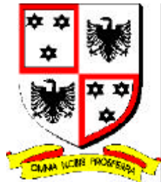
Caruel de Boran, écartelé d'Anfreville